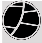
(H) Logoga magnet 2 tk