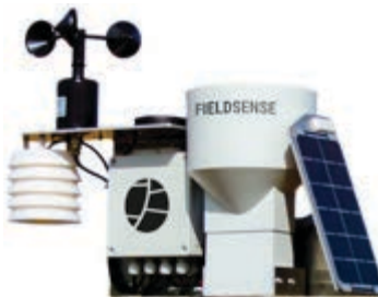
(F) Ilmajaam 1 tk.