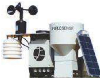
(F) Ilmajaam 1 tk.